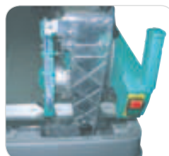
Buton pentru oprire incorporat in maner