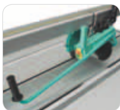
Maner pentru taierea placilor de dimensiuni mari