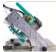
Taiere la 45°